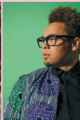
Glücklich sein. Das ist ihm wichtig. Sänger und Musiker Marc Sway hofft, auch in zehn Jahren noch glücklich zu sein.